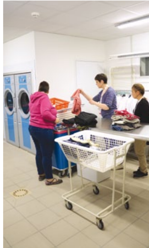
Entretien du linge Repassage, pliage, rangement.

Les activités techniques s'inscrivent dans une démarche d'apprentissage qui mobilise des compétences proches du milieu professionnel et de participation à la vie en collectivité.