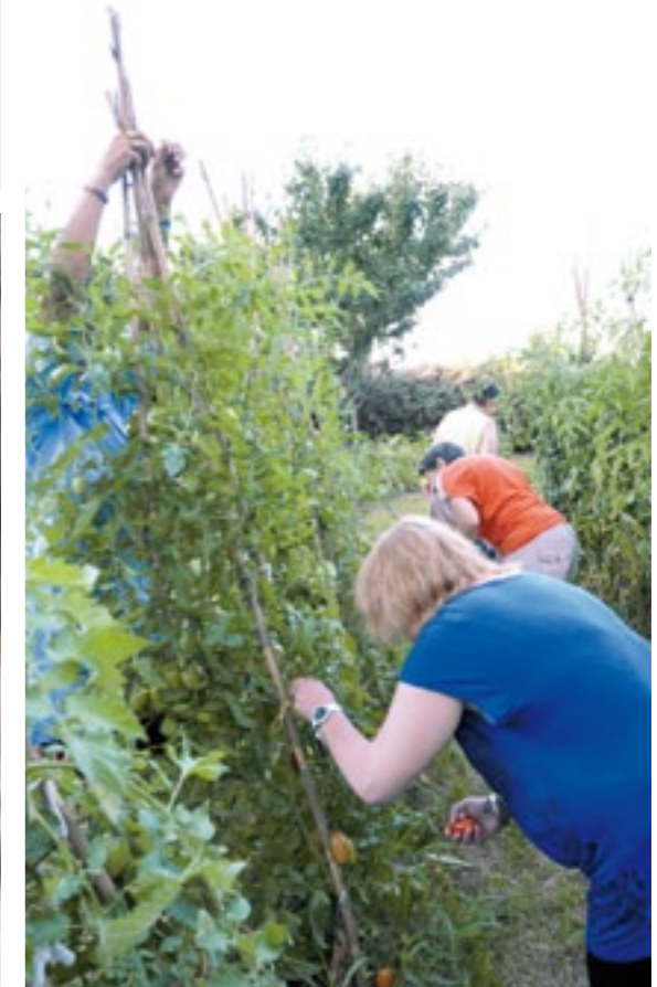
Entretien des espaces extérieurs Potager, vergers, espaces verts.